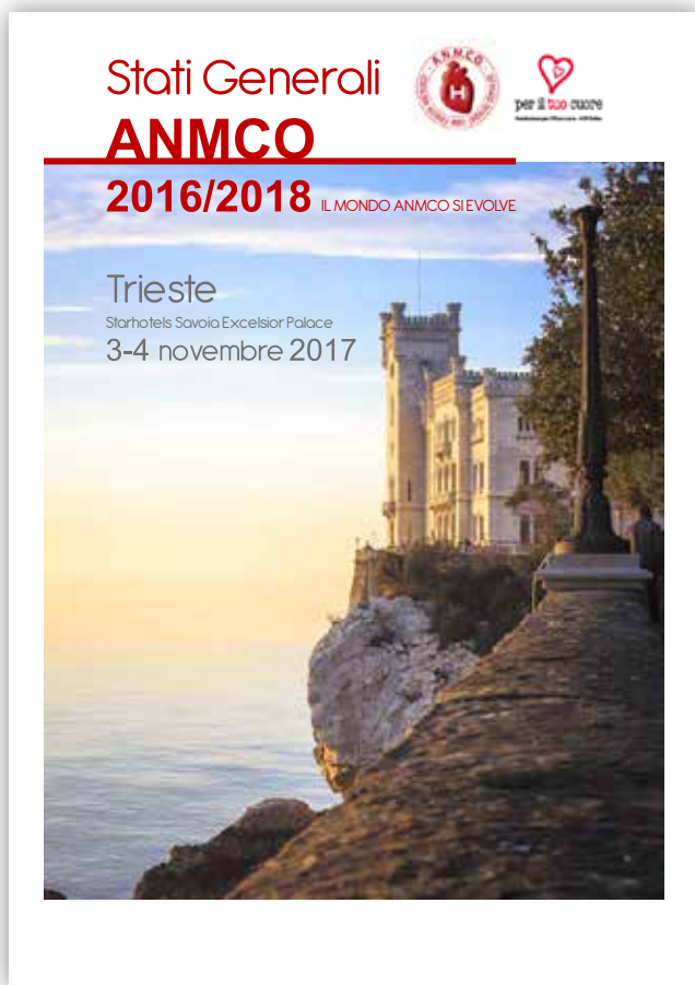
Rivista N. 218 / 219 - luglio / agosto - settembre / ottobre 2017

assoluta ... è stata la realizzazione della Jeopardy Game Session, un rischiatutto cardiologico in lingua inglese, in cui i giovani e talentuosi cardiologi ANMCO under 33 (anni) si sono cimentati, sfidandosi a "colpi di iPad" per arrivare in pole position. ... " - Il Congresso ANMCO 2017 - M.M. Gulizia (RIVISTA N. 217 - maggio/giugno 2017 - pagine 10-18); "L'ultima edizione del Congresso Nazionale ANMCO che si è appena conclusa sarà ricordata non solo per le molte e entusiasmanti novità e innovazioni ma anche per un ritorno al passato che ha molto emozionato coloro che hanno avuto il grande onore ed il vero onere di partecipare alla riedizione