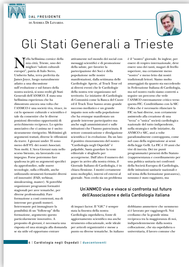
Rivista N. 220 - novembre / dicembre 2017, pag. 6

di un classico mai dimenticato: il Quotidiano del Congresso . ... il valore della riedizione del giornale cartaceo, edizione scomparsa quando nel 2007 fu deciso di sospendere la pubblicazione del foglio del Congresso per passare alla sola informazione via Web. ..." - Il Congress News Daily - C. Andriani (RIVISTA N. 217 - maggio/giugno 2017 - pagine 18-19). Continua, con regolarità (ogni numero di Cardiologia negli Ospedali) " Il Punto sugli Studi Clinici del Centro Studi ANMCO " - (RIVISTA N. 217 - maggio/giugno 2017 - pagine 24-25). Si svolge a Roma, nei giorni 21 e 22 settembre, la V Edizione